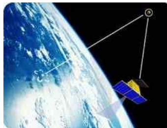
BayernSat nimmt Videobilder von der Erde auf und sendet sie ins Internet

Der Satellit BayernSat soll Live-Videobilder von der Erde an die Bodenstation übertragen, die diese ins Internet stellt. Internetnutzer sollen die Möglichkeit haben, von zu Hause - über Tastatur, Joystick oder Maus - die Kamera zu steuern, um dann innerhalb kürzester Zeit einen 'Astronautenblick' vom Satelliten auf die Erde werfen zu können.